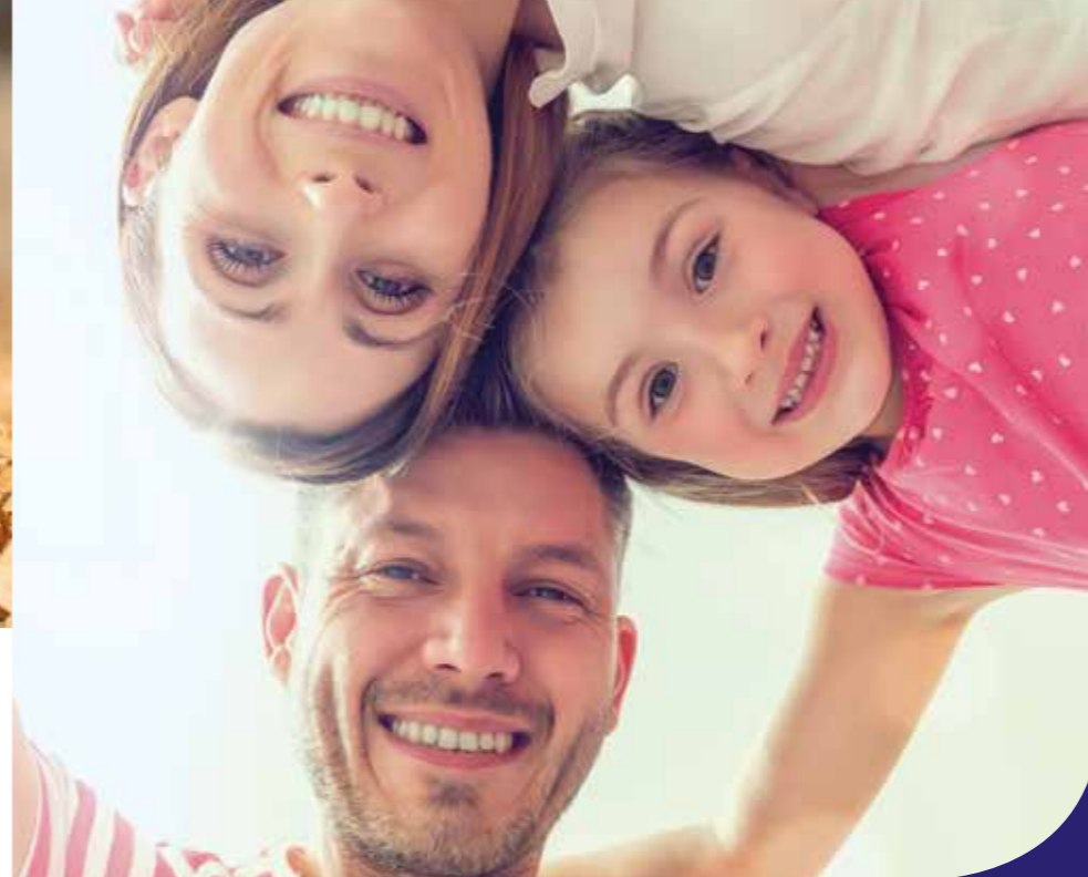
Photo Communication • Crédits photos : UEM Rémi Villegri - Adobe Stock